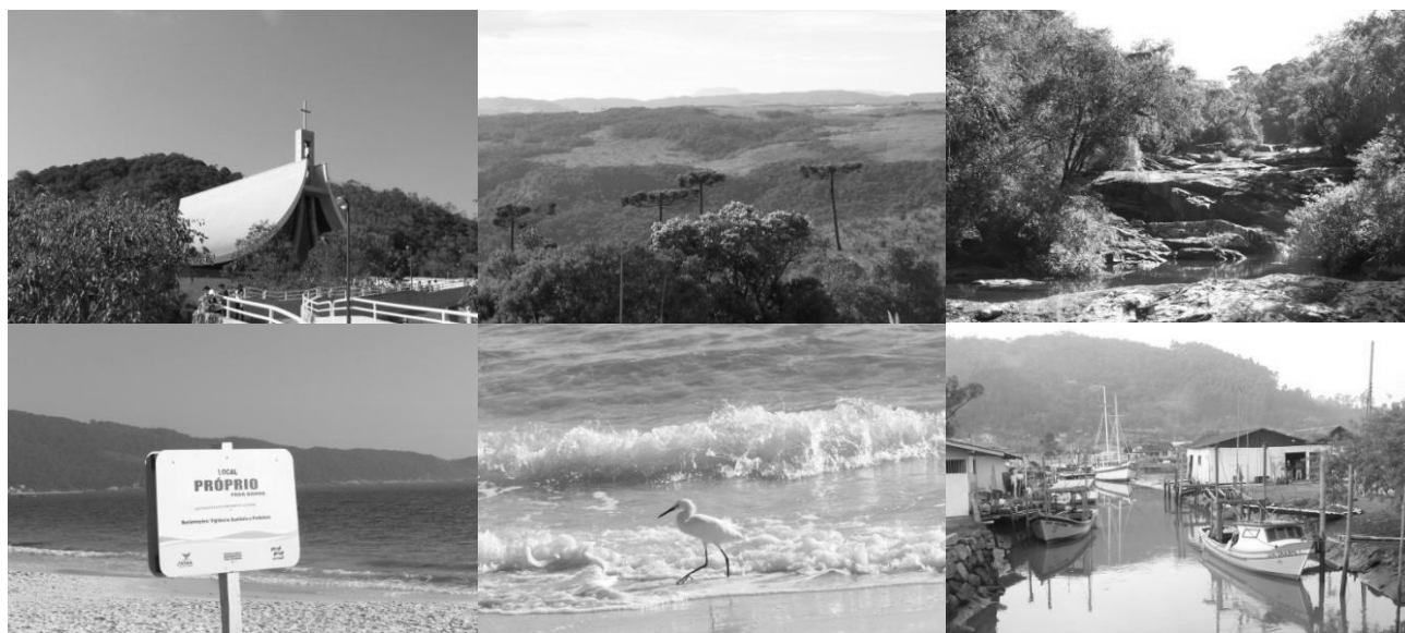
Figura 4 – Potencialidades encontradas na Bacia – Em sentido horário: turismo religioso, belezas cênicas e paisagísticas, qualidade ambiental e remanescentes florestais, praias com alta balneabilidade e pesca artesanal.