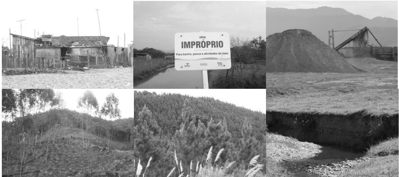
Figura 3 – Problemas encontrados na Bacia – Em sentido horário: ocupação irregular, contaminação de curso d’água, mineração de areia, supressão da vegetação nativa para reflorestamento com eucalipto, reflorestamento com pinus, e supressão de mata ciliar com assoreamento do rio.

sistema de saneamento; a utilização de agrotóxicos; a extração mineral; o desmatamento; a substituição da vegetação nativa por pinus/eucalipto; a presença de rejeitos industriais; a deposição de lixo em locais impróprios; o turismo e o crescimento urbano desordenado; e a falta de sensibilização, conhecimento e conscientização por parte de governantes locais e da população (Figura 3).