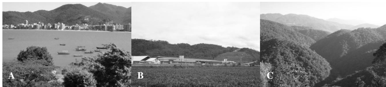
Figura 2 – Municípios de Itapema (A), Canelinha (B) e Angelina (C) no Baixo, Médio e Alto Vale do Rio Tijucas, respectivamente.

Na região do Alto Vale do Rio Tijucas, nos municípios de Angelina, Leoberto Leal, Major Gercino e Rancho Queimado, cujas altitudes atingem 1.200 metros acima do nível do mar, a característica predominante é o ambiente rural e o ar da serra. Os municípios são rurais, as famílias possuem pequenas e médias propriedades e vivem basicamente da agricultura e do turismo rural. Nessa região também encontra-se fragmentos florestais, inclusive remanescentes de Floretas de Araucárias (Figura 2).