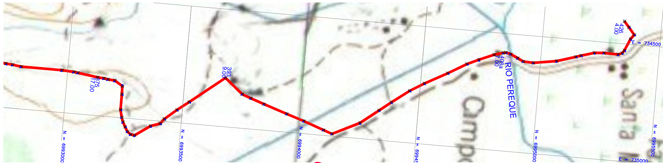
2 PLANTA (IBGE) ESCALA 1/10.000